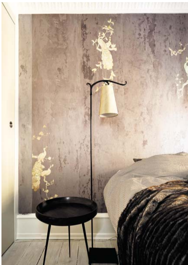
PELS OG LÆDER. I soveværelset er sengetæppet af klippet pels fra Zinc. Skabet er bygget af mdf-plader, og skydedørene er betrukket med læder fra Pierre Frey. Bag sengen er et vægmalerier fra engelske Elli Popp.

Ætanolpejsen er beklædt med tapet, der ligner granit, åleskinds-tapetet omkring den er fra Ellitis. Det gulvlange gardin er fra Soleil Bleu, og den ombetrukne øreklapstolen er overtaget fra en kunde. Puffen er eget design med fake skind fra Pierre Frey.