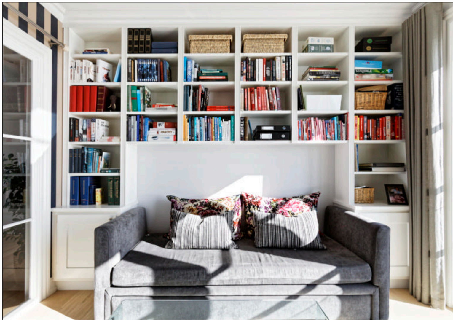
Et værelse på første sal fungerer som kombineret kontor og gæsteværelse.