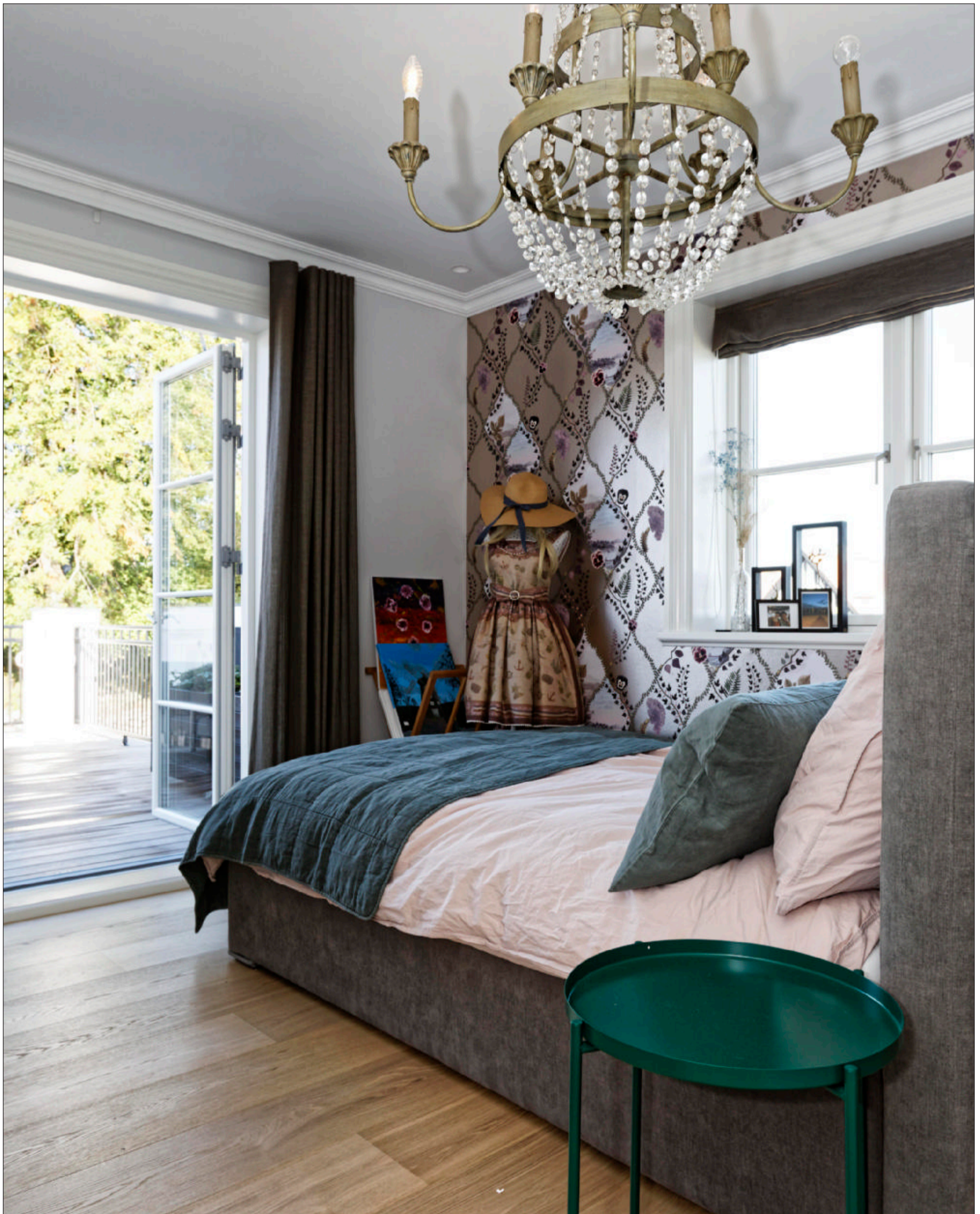
Datterens værelse mod vejen har tapet fra Christian Lacroix og lysekroner fra Becare.