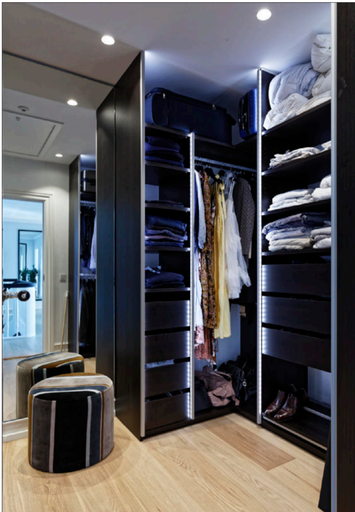
Walk-in-closet med skabe af sortbejdet eg fra Unoform.