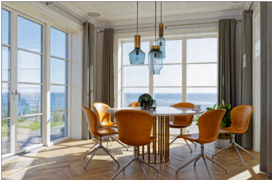
Til hverdag spiser familien ved det runde bord i køkkenet. Det er specialfremstillet med stel af messing og bordplade af Daino Reale-marmor. Stolene i gult skind fra Boconcept er medbragt fra familiens tidligere hus. Glaslamperne er fra Konsthantverk.