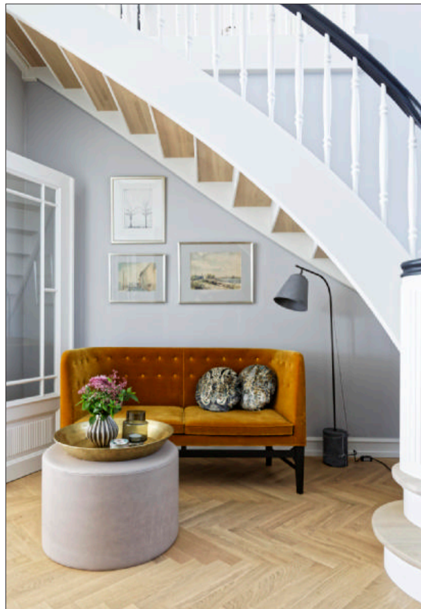
Arne Jacobsens Mayor-sofa med karrygult velour er købt på auktion. Den er en af husets ganske få møbler i klassisk, dansk design.

som en minivinkælder i flere etager, der kommer til dig, når du trykker på en knap.