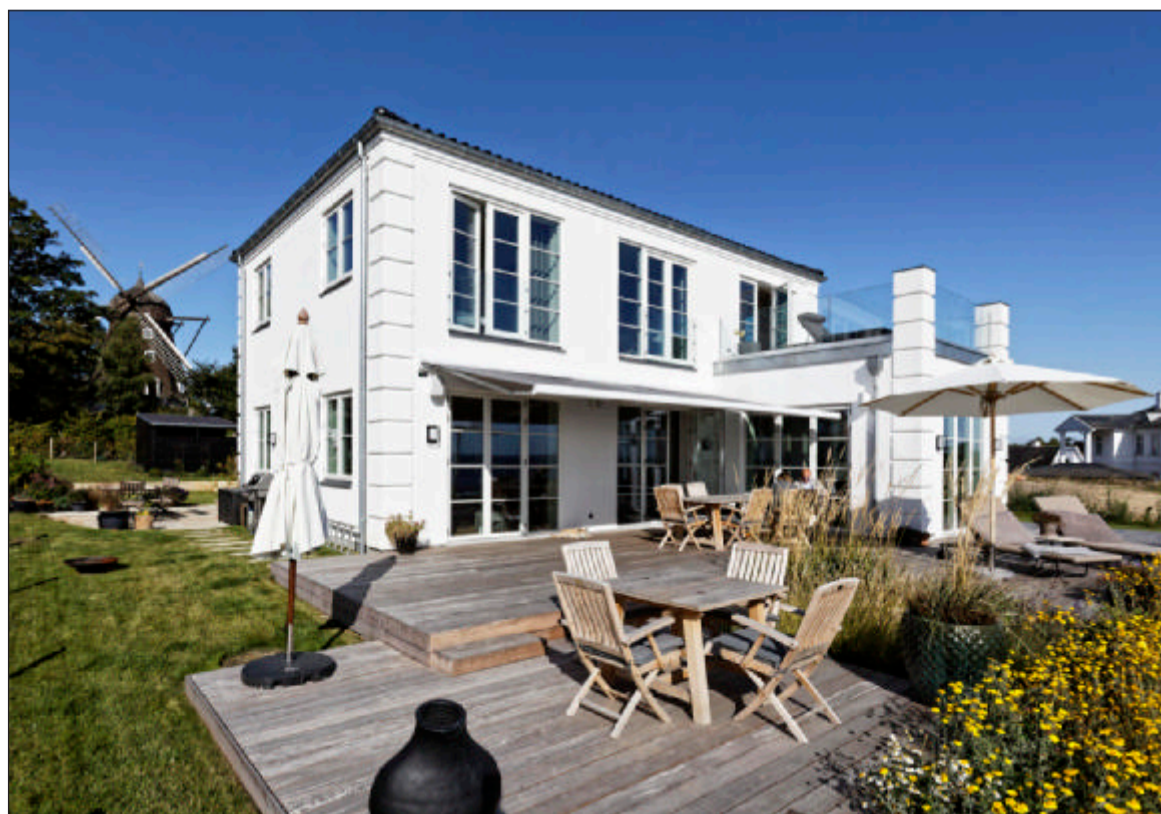
Palævillaen fra 2020 er opført som en klassisk patriciervilla af Huscompagniet. Havegangene er belagt med indiske sandsten fra Sandstone.dk, og terrassen mod havet er af cumarutræ.

Køkkenøen er beklædt med "Trilium" dektion, en form for keramisk materiale. Køkkenet er i sortbejdsset og fra Unoform. I køkkengulvet er indlejret en blanding af vinkøleskab og vinkælder i et system fra firmaet Vinorage med vine i flere etager. Ved et tryk på en kontakt hæver det sig op af gulvet.