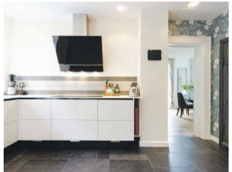
Bag det hvide Svane-køkken er italienske fliser og på gulvet fliser i forskellige størrelser. Begge er fra Vintage Pietra.