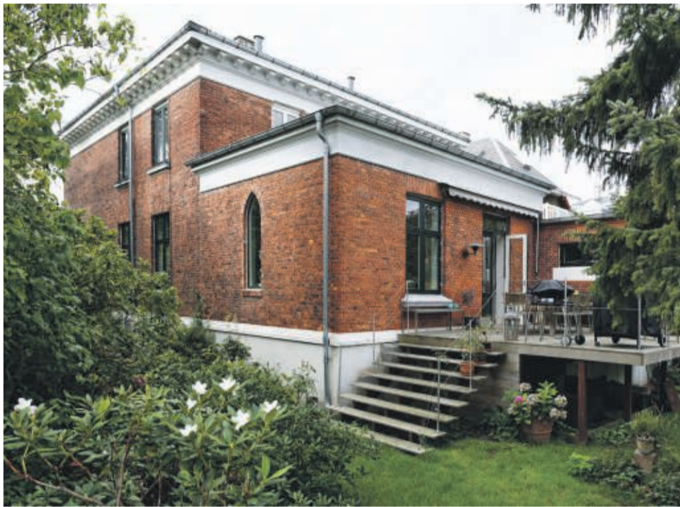
Den statelige villa fra 1885 ligger på en stille villavej kun 100 meter fra Frederiksbergs travleste forretningsstrøg, så beliggenheden kan ikke være mere central.