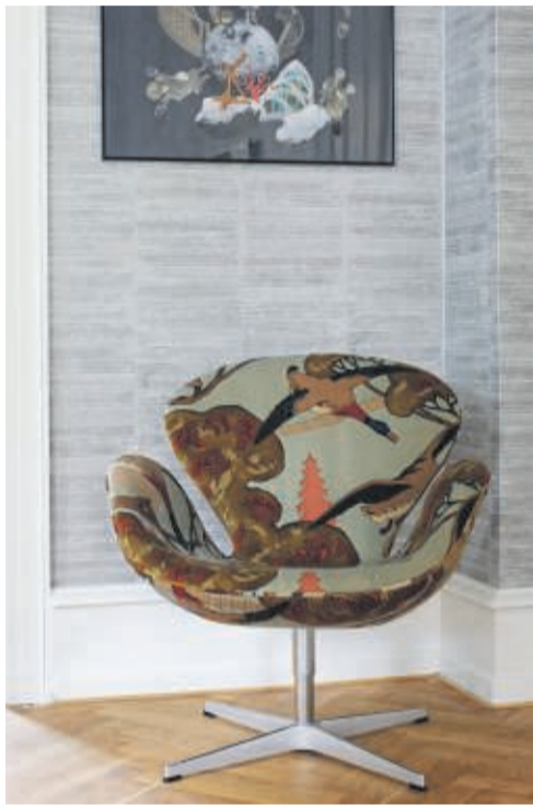
Arne Jacobsens Svane-stol fra familiens tidligere hjem har fået nyt liv med tekstil fra Mulberry.