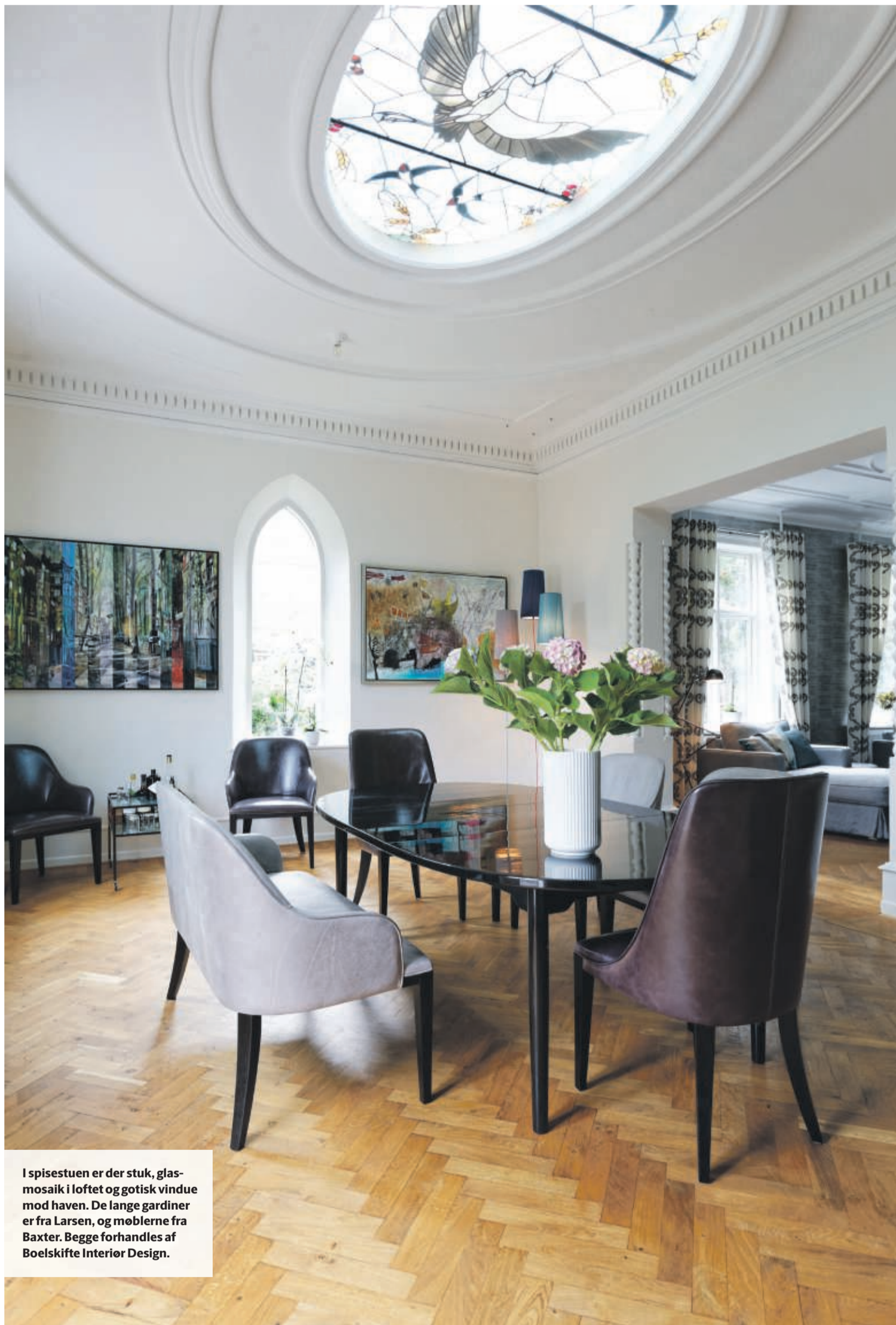
I spisestuen er der stuk, glasmosaik i loftet og gotisk vindue mod haven. De lange gardiner er fra Larsen, og møblerne fra Baxter. Begge forhandles af Boelskifte Interiør Design.