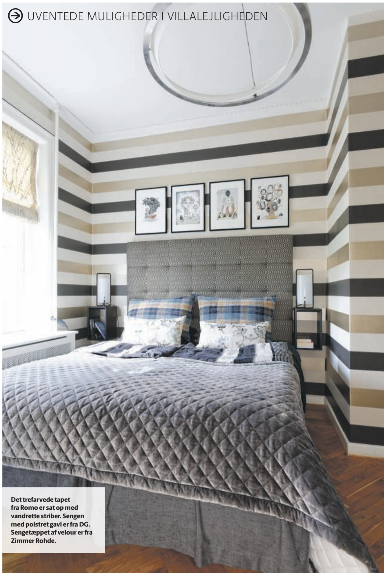
Det trefarvede tapet fra Romo er sat op med vandrette striber. Sengen med polstret gavl er fra DG. Sengetæppet af velour er fra Zimmer Rohde.