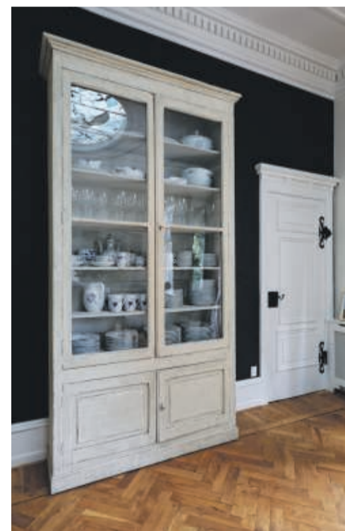
På spisestuens endevæg er sort tapet fra Krohma. Vitrineskabet til glas og porcelænen er fra K & Co.

● 170 kvm stuelejlighed med fuld kælder fra 1885 på Frederiksberg med 700 kvm have.