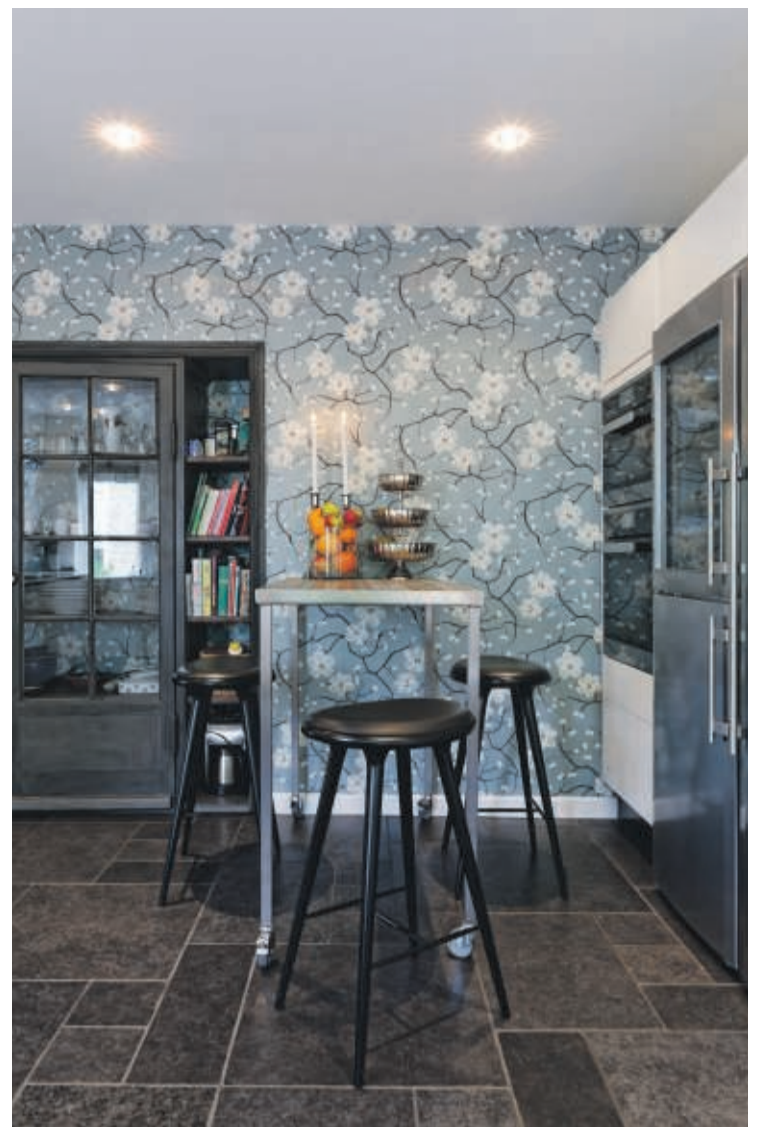
Intet er bevaret af det oprindelige køkken. Her er specialbygget bord med italienske fliser og barstole i træ og læder. Tapetet i blålige toner er fra Krohma. Fliserne er fra Vintage Pietra.